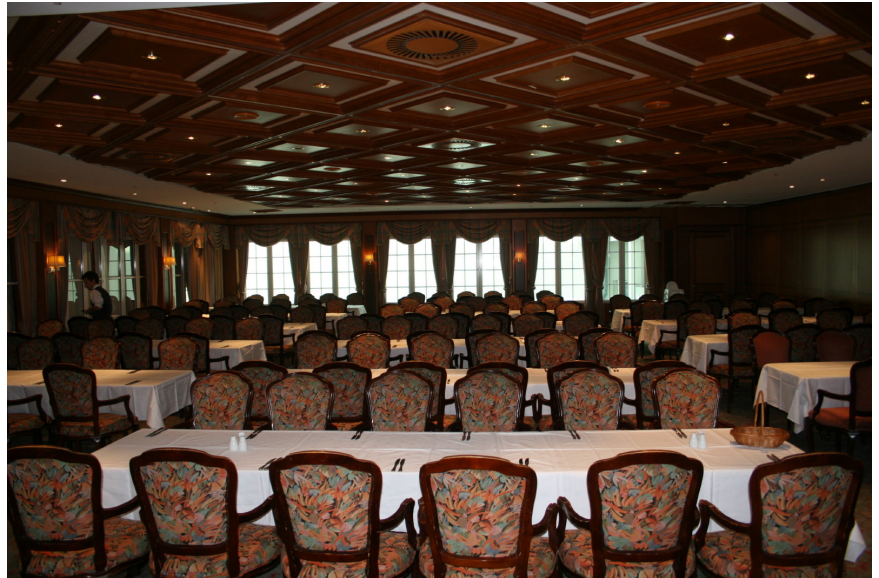
Spisesalen Lillehammer Hotell

Det blir utlodning under arrangementet, underholdning og dans til levende musikk etter middagen. På onsdag blir det aktiviteter og de som ønsker det kan være til torsdag morgen.